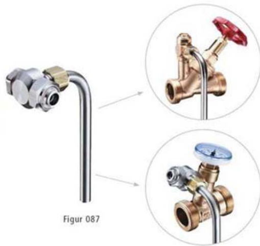
Abbildung: Beispiele für Probenahmehähne