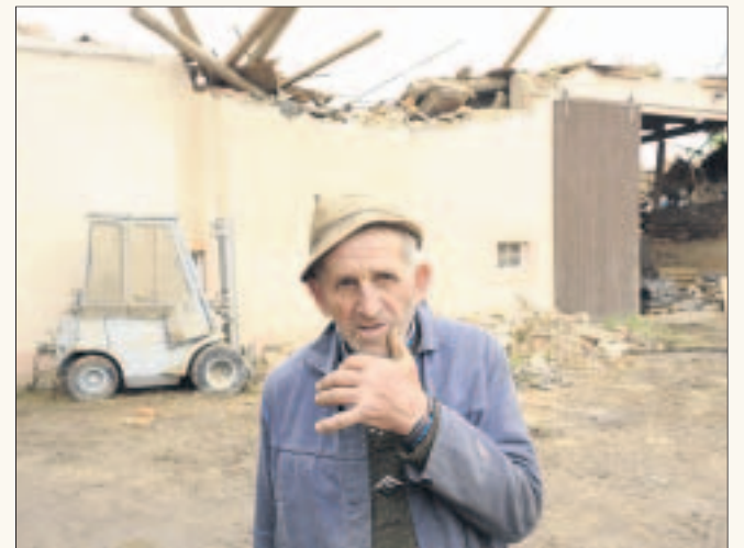
Es muss nicht immer ein Tornado sein. Sturmschäden gibt es auch bei geringeren Windgeschwindigkeiten.

Fazit: Jeder Hausbesitzer sollte die Möglichkeiten einer privaten Vorsorge prüfen und die Angebote vergleichen!