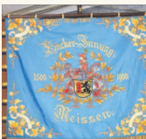
Die Innungsfahne der Bäckerinnung.