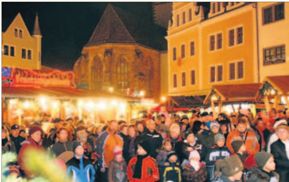
Höhepunkt der Familienweihnacht in Meißen ist das tägliche Programm zur Öffnung des Kalenderfensters.

„Der WKV sucht sein Glück und lässt Las Vegas weit zurück“,