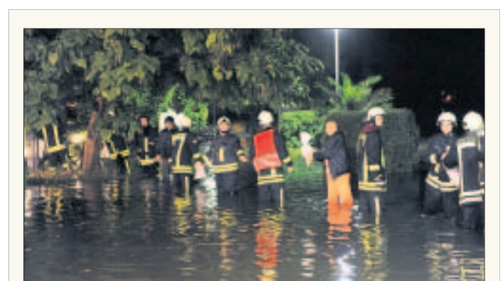
Beim Hochwasser in Großenhain hatte die Feuerwehr alle Hände voll zu tun wie hier am Parkplatz Rödereck an der Weberallee, beim Stapeln der Sandsäcke.

Das Gespräch war wichtig, um die Vorwürfe mangelhafter Infor-