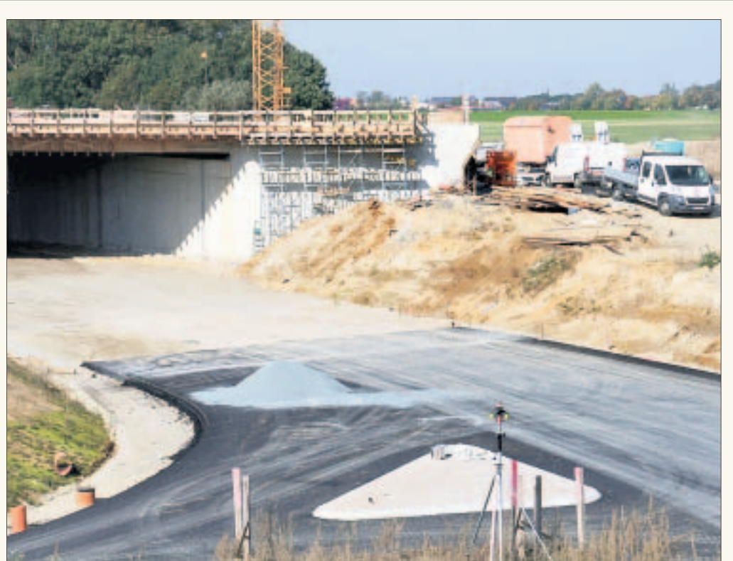
Mit dem 2. Bauabschnitt der B 169 zwischen Riesa und Seerhausen soll sich die Verkehrssituation Richtung Autobahn weiter entspannen. Doch noch fehlt der wichtigste Abschnitt zwischen den Stauchitzer Ortsteilen und Döbeln.