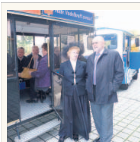
Bitte einsteigen zur Stadtrundfahrt Riesa.

Einen Erlebnistag in Riesa verspricht das Tourismusbüro auf der Hauptstraße 61. Die Stadt wirbt in der kalten Jahreszeit für eine unterhaltsame Tagesreise. Die kann mit einer Bahnfahrt mit dem „Stahlmax“ beginnen, führt über das Nudelcenter der Teigwaren Riesa GmbH mit einem Besuch in der Gläsernen Produktion und einem Essen im Nudelrestaurant „Makkaroni“. Spätestens bei diesem Programmpunkt weiß der Gast, dass Riesa das Image der grauen Stahlstadt längst abgelegt hat. Empfehlenswert ist auch das jüngst modernisierte Stadtmuseum mit der Geschichte des ersten Klosters der Mark Meißen oder den neuesten Ausstellungen. Wei-