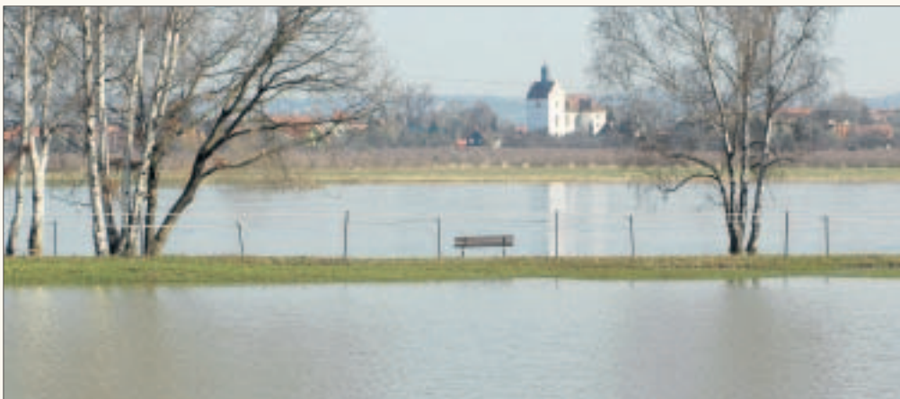
Ein Hochwasser kann immer wieder auftreten, nicht nur entlang der Elbe, wie hier in Scharfenberg.