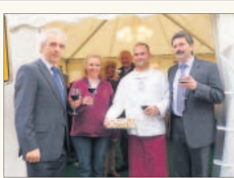
Ministerpräsident Stanislaw Tillich zu Gast in der Meißner Pagode.

Während Meißner Wein, Aronibratwürste und -saft wie Kuchen oder das Bier sich als lukullische Magneten erwiesen, war das Kunstangebot ein Wagnis. Rund 2.000 Gäste hat der Riese aus Riesa im Meißner Pavillon im Laufe des Tages gezählt und darunter